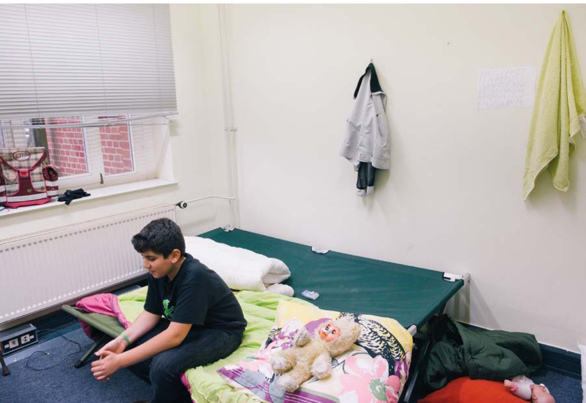
Punainen Risti järjestää tilapäistä majoitusta turvapaikanhakijoille Saksan Potsdamissa. Saksa on ottanut vastaan Eurooppaan saapuneista yli miljoonasta pakolaisesta merkittävän osan.