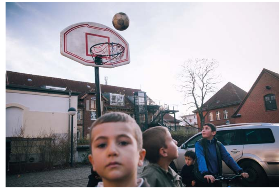
Pallopelit ja Saksan Punaisen Ristin vapaaehtoisten kunnostamat polkupyörät tuovat iloa läpi Euroopan kulkeneille pakolaislapsille. Lapsille pyritään järjestämään mahdollisuus koulunkäyntiin mahdollisimman pian maahan saapumisen jälkeen.