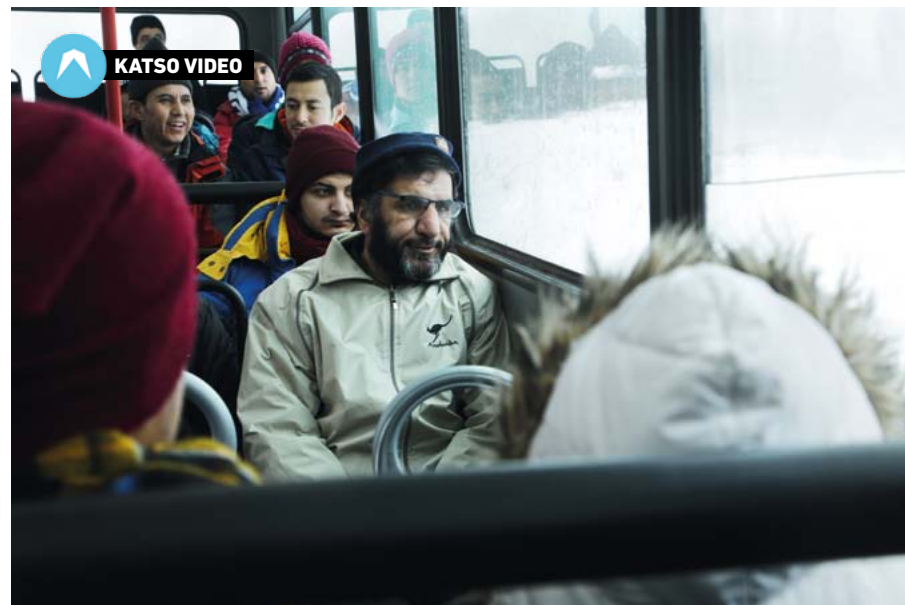
Suomeen saapui vuoden 2015 aikana 32 478 turvapaikanhakijaa, enemmän kuin koskaan ennen. Valtaosa ylitti rajan Haaparannasta Tornioon matkustettuaan Ruotsin läpi bussilla.